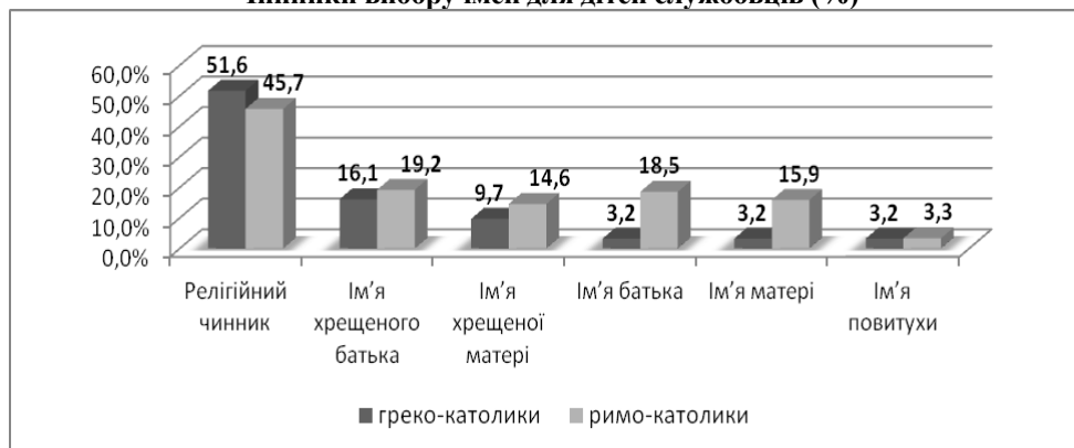
Чинники вибору імен для дітей службовців (%)

Соціально-професійна група «підприємці, купці, власники майна». У XIX ст. Львів став головним центром торгівлі зі Сходом на західній частині шляху: «Київ – Перемишль – Краків – Прага». Активний розвиток міського цехового та позацехового